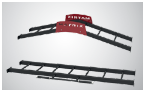
ДВА РУКОХОДА ПРЯМОГО И ПИРАМИДНОГО ТИПА