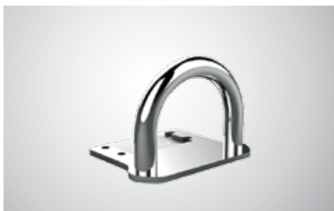
КРЕПЛЕНИЕ ДЛЯ ТРЕНИРОВОЧНЫХ КАНАТОВ