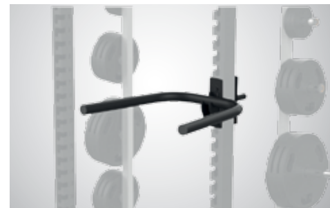
БРУСЬЯ ДЛЯ ОТЖИМАНИЙ