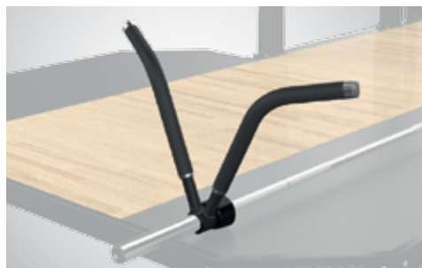
РУКОЯТЬ ДЛЯ ОЛИМПИЙСКОГО ГРИФА