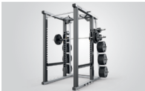
ДВЕ МОЩНЫЕ РАМЫ MATRIX MAGNUM