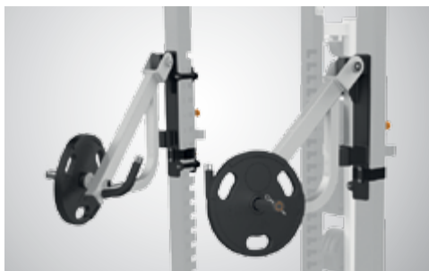
РЫЧАГИ ДЛЯ ЖИМА