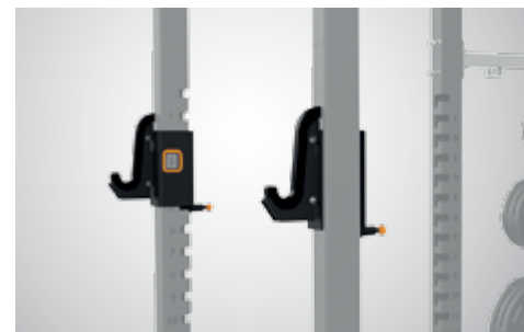
УВЕЛИЧЕННЫЕ КРЮКИ ДЛЯ ОЛИМПИЙСКОГО ГРИФА