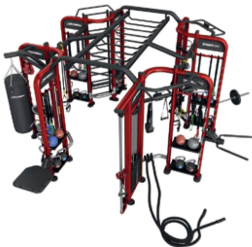
LifeFitness Syngry 360